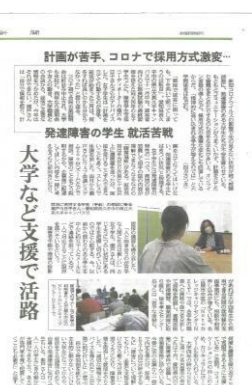
▲ Notoカレッジの障害学生支援における取組が2020年12月に中日新聞で紹介されました