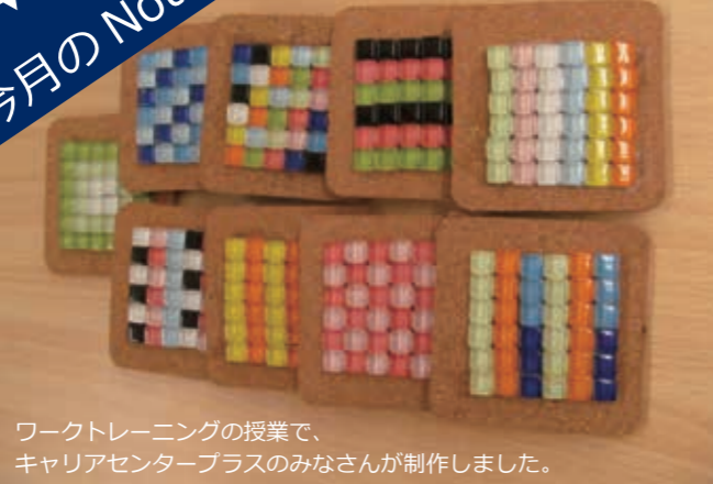
ワークトレーニングの授業で、 キャリアセンタープラスのみなさんが制作しました。